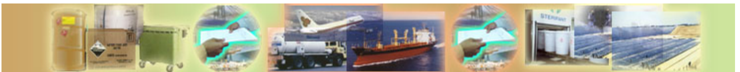
เอกสารอ้างอิง และสารบัญ

การจัดระบบเอกสารกำกับการขนส่งของเสียอันตรายดังกล่าวในต่างประเทศ เช่น สหรัฐอเมริกา ได้มี การพัฒนาถึงขั้นที่สามารถแจ้งรายละเอียดผ่านระบบเครือข่ายคอมพิวเตอร์ (computer network system) กันแล้ว สำหรับประเทศไทยถึงแม้ว่าจะได้เริ่มมีการนำมาใช้กันบ้างในนิคมอุตสาหกรรมต่างๆ แต่ก็ยังไม่เป็นระบบและ เป็นไปในลักษณะต่างคนต่างทำ ดังนั้นเพื่อให้ผู้ประกอบการอุตสาหกรรมทั้งภาคการผลิตและการบริการ ผู้ประกอบการขนส่ง ผู้รับกำจัด ได้เกิดความรู้ความเข้าใจ และสามารถนำไปปฏิบัติได้อย่างมีประสิทธิภาพ กรม ควบคุมมลพิษจึง ได้จัดทำคู่มือซึ่งจะมีรายละเอียดในการปฏิบัติ ตั้งแต่การขอขึ้นทะเบียน ขั้นตอนการปฏิบัติตาม ระบบเอกสารกำกับการขนส่งภายในประเทศ และการนำเข้า – ส่งออกของเสียอันตรายระหว่างประเทศซึ่งจะทำ ให้การจัดทำระบบเอกสารกำกับการขนส่งของเสียอันตรายมีมาตรฐานเดียวกัน